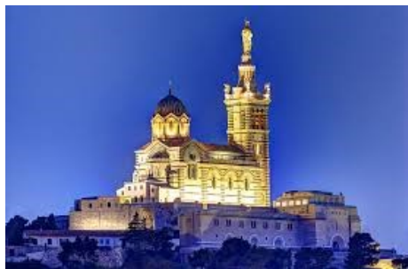
Basilique Notre-Dame de la Garde