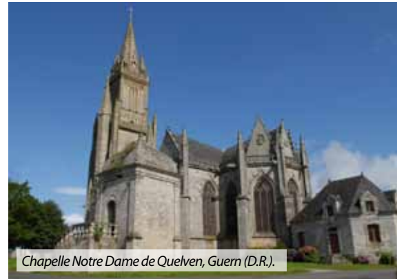
Chapelle Notre Dame de Quelven, Guern.

♦Jeudi 4 août 15h, Guern : Dans le cadre des «Jeudis de Quelven» , à 15h, présentation de l'Orgue en tribune. 15h30, visite guidée du sanctuaire et présentation de la Vierge ouvrante, 17h, récital d'orgue en vidéo projection, par Clément Geoffroy, répertoire baroque. Les activités débutent très précisément à l'heure et les portes du sanctuaire