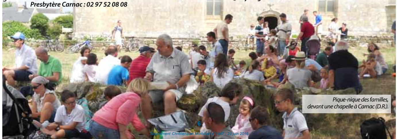
Pique-nique des familles, devant une chapelle à Carnac.