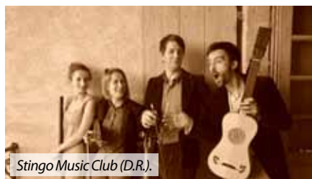
Stingo Music Club

♦Mercredi 20 juillet 20h, chapelle de Locmaria à Landévant : « chapelle en concert » . Concert de musique classique et traditionnelle dans le cadre de l'exposition et de «Détour d'Art», circuit du patrimoine de l'Office de Tourisme d'Auray Communauté. Ce mercredi : Stingo Music Club, groupe baroque très rock revisitant les standards anglo-saxons de toutes les époques. Médiation : un guide de l'office de tourisme présente la chapelle. Les musiciens présentent leur programme et leurs instruments.