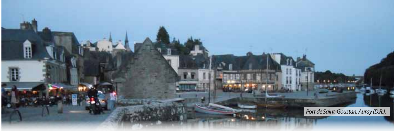
Port de Saint-Goustan, Auray.

projection de différentes œuvres d'art du patrimoine chrétien.