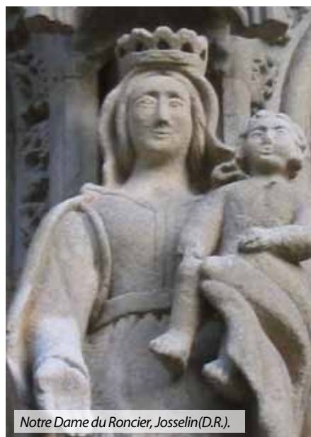
Notre-Dame du Roncier, Josselin.

- fête celtique, église de Saint-Gildas-de-Rhuys : 9h30 et 11h, Messe en l'abbatiale, Fête celtique, 19h : repas inter-paroissial à la salle Kercaradec. 21h : Fest-Noz.