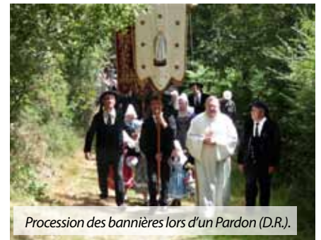
Procession des bannières lors d'un Pardon.